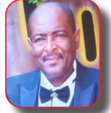
تقرير: سيبويه يوسف