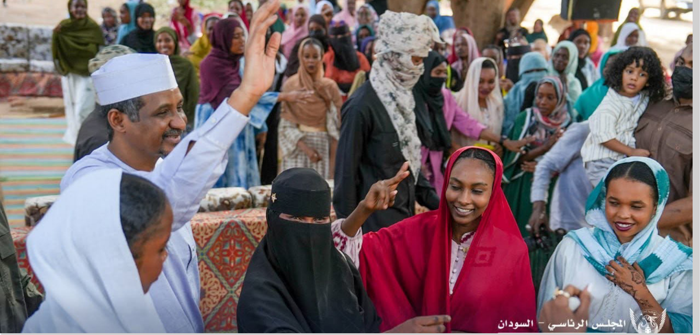
المجلس الرئاسي - السودان