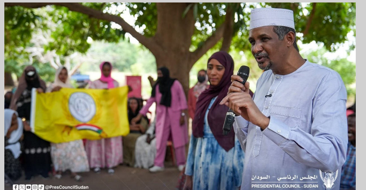
المجلس الرئاسي - السودان PRESIDENTIAL COUNCIL - SUDAN

لبى رئيس المجلس الرئاسي، الفريق أول محمد حمدان دقلو، اليوم، دعوة طلاب الشهادة السودانية للمشاركة في احتفالهم بمناسبة ختام الامتحانات، في فعالية عكست أجواءً من الفرح والاعتزاز بإنجاز الاستحقاق التعليمي. وأكد دقلو، خلال كلمته في الاحتفال، أهمية مواصلة دعم قطاع التعليم وتوفير مقومات استمراره، مشيداً بعزيمة الطلاب وإصرارهم على مواصلة مسيرتهم التعليمية، ومثمناً جهود المعلمين والوزراء والإدارات التعليمية، إلى جانب جميع الجهات التي أسهمت في نجاح امتحانات الشهادة السودانية. وقال إن نجاح امتحانات الشهادة السودانية