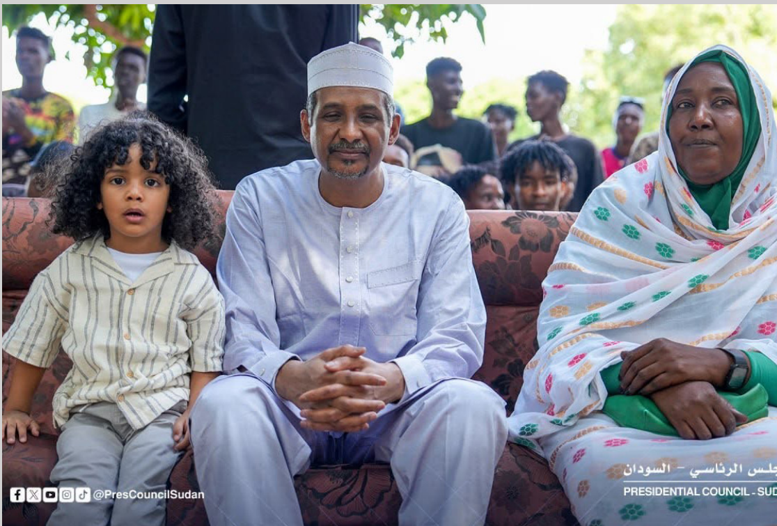
المجلس الرئاسي - السودان PRESIDENTIAL COUNCIL - SUDAN

في تمكين الطلاب من الدراسة والجلوس كبرياً في مسيرة التعليم والبلاد، معربة للاختبارات، ودعا بالرحمة والمغفرة عن شكرها لرئيس المجلس الرئاسي للشهداء، وبالشفاء للجرحي، وبالعودة على تلبية دعوة الطلاب ومشاركته لهم احتفال ختام الامتحانات. وأضاف أن نجاح امتحانات الشهادة السودانية جاء ثمره لتضافر جهود المؤسسات الحكومية والإدارات المجتمعية، بما أسهم في توفير البيئة المناسبة للطلاب لأداء امتحاناتهم، رغم التحديات التي فرضتها ظروف الحرب.